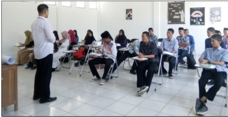
Gambar 3. Menyampaikan tujuan dan motivasi