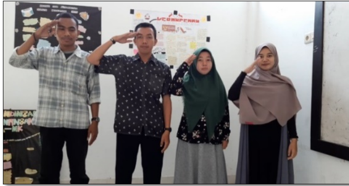
Gambar 7. Penampilan yel-yel