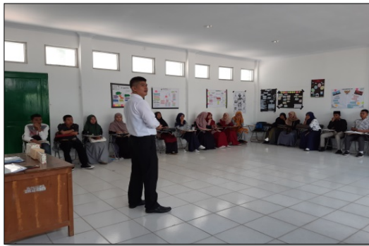
Gambar 9. Umpan Balik