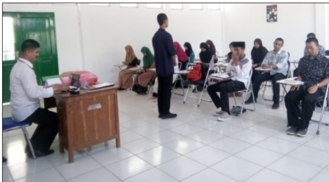
Gambar 2. Berdoa sebelum Belajar