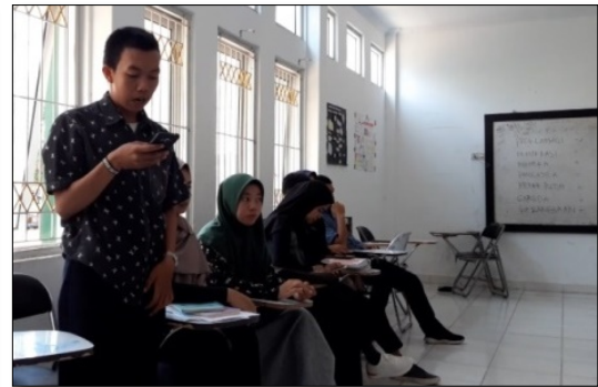
Gambar 10. Menyimpulkan