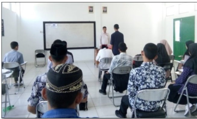
Gambar 1. Laporan mahasiswa