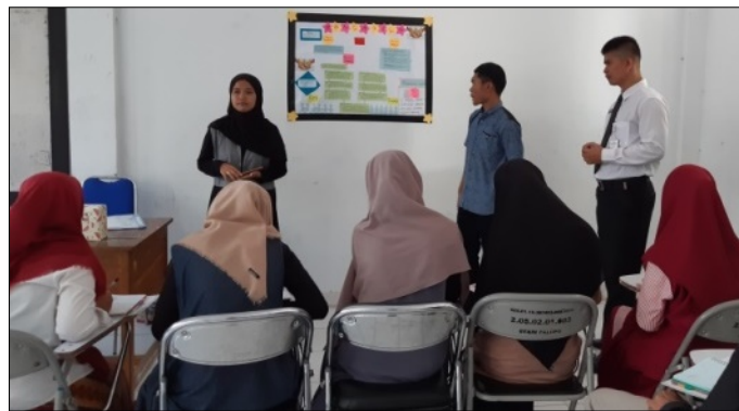
Gambar 8. Kunjung Karya