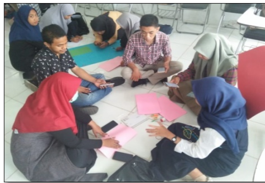
Gambar 6. Kerja Kelompok