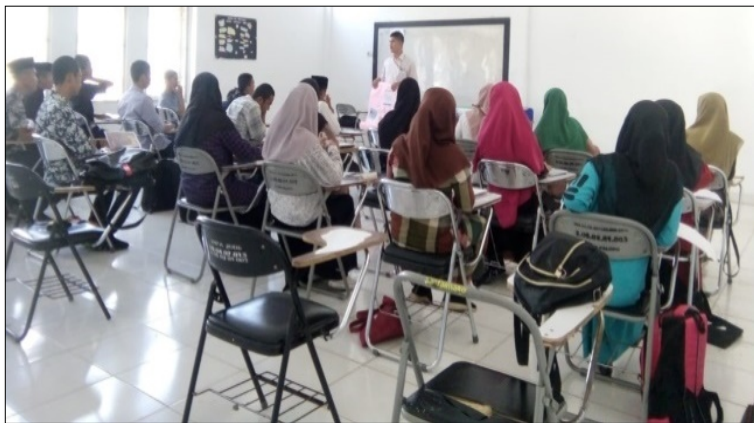
Gambar 4. Dosen menyampaikan informasi