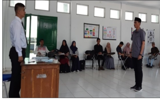
Gambar 12. Melapor dan Berdoa Setelah Belajar