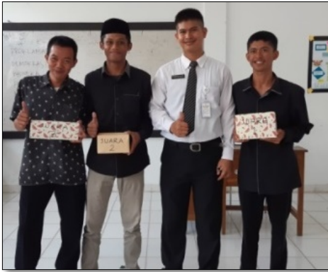
Gambar 11. Memberi Penghargaan