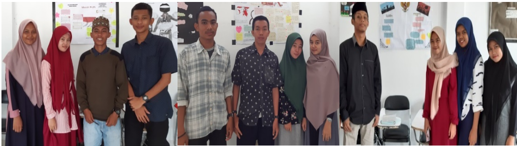
Gambar 5. Kelompok Mahasiswa

Pembentukan kelompok secara heterogen, karena tidak boleh ada diskriminasi terhadap mahasiswa.