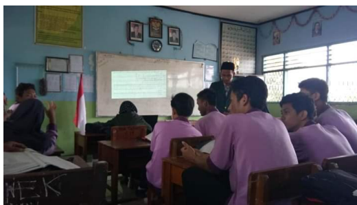
Gambar 4. Dokumentasi Praktik Mengajar Siswa Laki-laki 1 (S3)

Pada komponen penguasaan materi pelajaran, penerapan strategi pembelajaran yang mendidik, dan penerapan pendekatan saintifik dilakukan dengan baik. Pada komponen penilaian, S2 tidak memberikan tes tulis untuk penilaian pengetahuan dan keterampilannya. S2 juga tidak melaksanakan tindak lanjut dengan memberikan tugas rumah dan memberikan tugas untuk mempelajari materi pelajaran berikutnya.