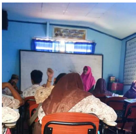
Gambar 2. Dokumentasi Praktik Mengajar Siswa Perempuan 1 (S1)

Pada Gambar 2, S1 mengajar materi persamaan trigonometri kelas XI. S1 melakukan komponen apersepsi dan motivasi untuk aspek menggali pengetahuan prasyarat, menyampaikan manfaat materi pembelajaran, mendemonstrasikan sesuatu yang terkait materi pembelajaran, dan menyampaikan manfaat materi pembelajaran. S1 mengajukan pertanyaan, akan tetapi pertanyaan yang diajukan S1 belum maksimal karena hanya menanyakan materi sebelumnya saja. Sedangkan pada komponen penyampaian kompetensi dan rencana kegiatan dilakukan satu aspek saja yaitu menyampaikan kemampuan yang akan dicapai peserta didik. S1 tidak menyampaikan rencana kegiatan pembelajaran pada hari ini dan S1 terlalu cepat dalam menjelaskan materi.