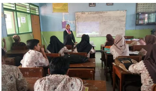
Gambar 3. Dokumentasi Praktik Mengajar Siswa Perempuan 2 (S2)

Pada komponen penguasaan materi pelajaran, penerapan strategi pembelajaran yang mendidik, dan penerapan pendekatan saintifik dilakukan dengan baik. Akan tetapi pada aspek menyajikan kegiatan peserta didik untuk berkomunikasi (mengkomunikasikan), S1 tidak membiarkan siswa presentasi terlebih dahulu dan S1 tidak memberikan kesempatan siswa laki-laki untuk presentasi. Pada komponen penilaian, S1 tidak memberikan tes tulis untuk penilaian pengetahuan dan keterampilannya.